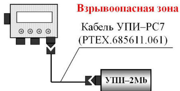
Рисунок 1 – Схема підключення кабелю

Кабель УПИ–РС7 РТЕХ.685611.061 (далі по тексту – кабель) призначений для підключення пристроїв перенесення інформації УПИ-2Мб до коректорів обсягу газу серій ВЕГА модифікацій «N0» і «NM» і комплексам вимірювальним КВ модифікацій «М» і «0».