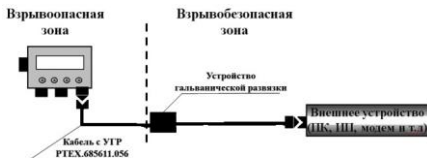
Рисунок 1 - Схема підключення кабелю з пристроєм гальванічної розв'язки

Пристрій гальванічної розв'язки має маркування вибухозахисту \text{Ex} «II (2)G [Ex ib Gb] IIA» і повинен встановлюватися поза межами вибухонебезпечної зони. Довжина кабелю 15 м.