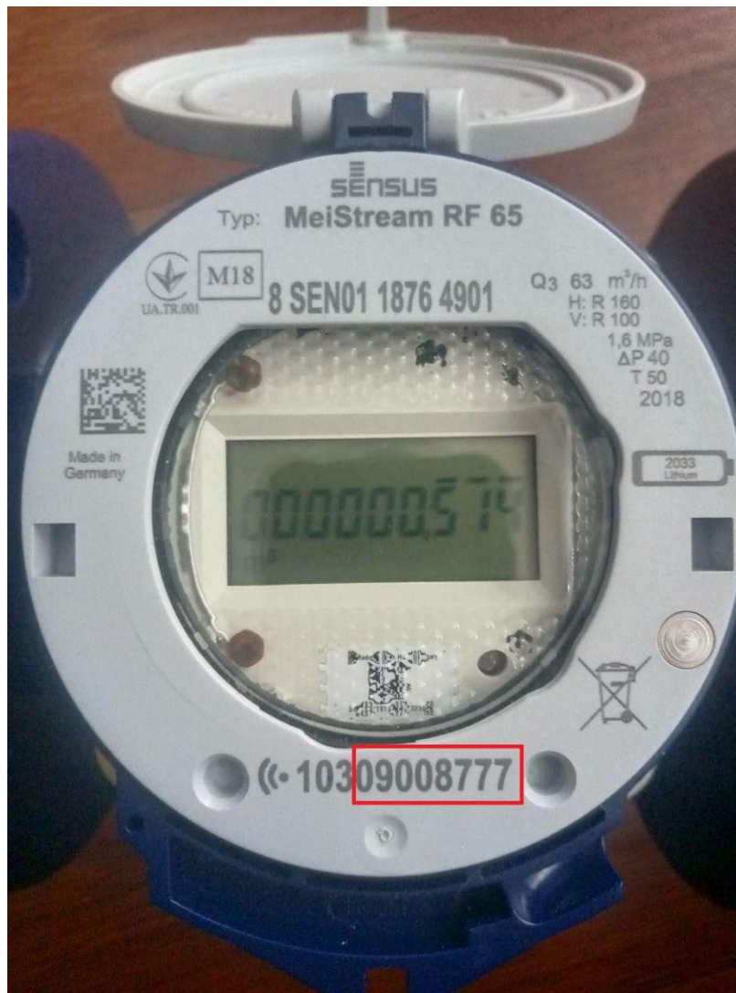
Червоним виділені цифри, які необхідно вводити при прив'язці лічильників Sensus MeiStream RF