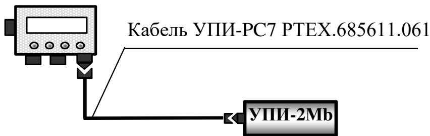
Рисунок 2 – Схема підключення кабелю