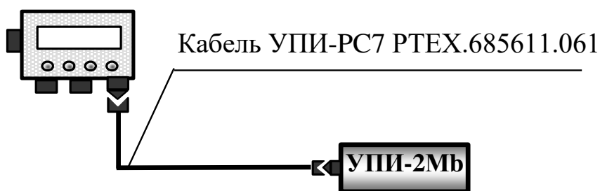
Рисунок 2 – Схема підключення кабелю