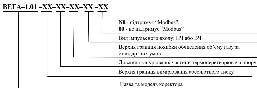
Рисунок 1 – Схема складання умовного позначення коректору ВЕГА-1.01