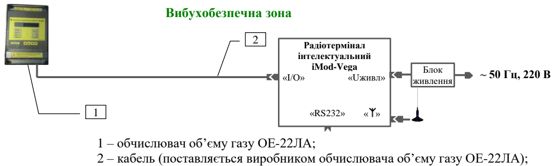
Рисунок 3 – Схема підключення радіотерміналу до обчислювача об'ємної витрати і об'єму газу ОЕ-22ЛА

УВАГА! КАБЕЛЬ КПОЕ ПОВИНЕН БУТИ ІЗОЛЬОВАНИЙ ВІД ІНШИХ ЕЛЕКТРИЧНИХ ПРОВОДІВ, ЯКІ МОЖУТЬ ВИКЛИКАТИ ЕЛЕКТРИЧНІ ПЕРЕШКОДИ, ТА, ПО МОЖЛИВОСТІ, ПОВИНЕН БУТИ ПРОКЛАДЕНИЙ В ІЗОЛЯЦІЙНІЙ ТРУБІ ЯК НАЙБЛИЖЧЕ ДО ПОВЕРХНІ ҐРУНТУ.