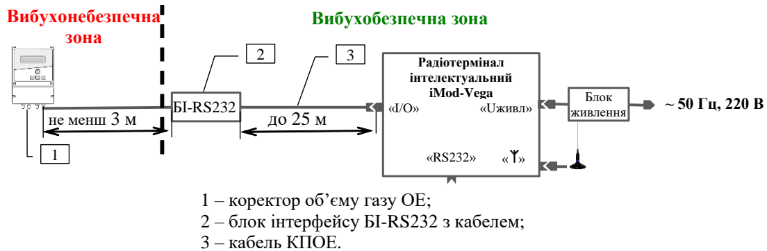
Рисунок 2 – Схема підключення радіотерміналу до коректора об'єму газу ОЕ

Схема підключення радіотерміналу наведена на рисунках 2, 3.